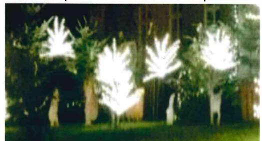
Au pied des sapins, les réalisations des enfants pendant les TAPs

Pour la joie des enfants ... et la vôtre : N'hésitez pas à vous faire connaître en mairie.